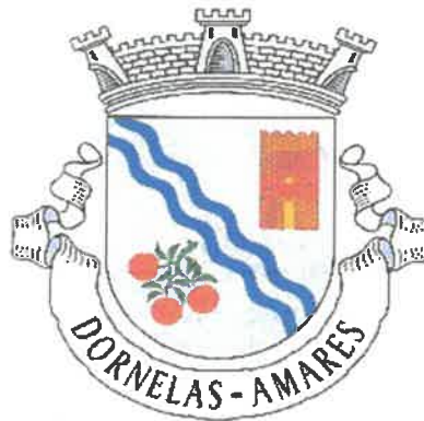
TABELA GERAL DE TAXAS DA JUNTA DE FREGUESIA DE DORNELAS